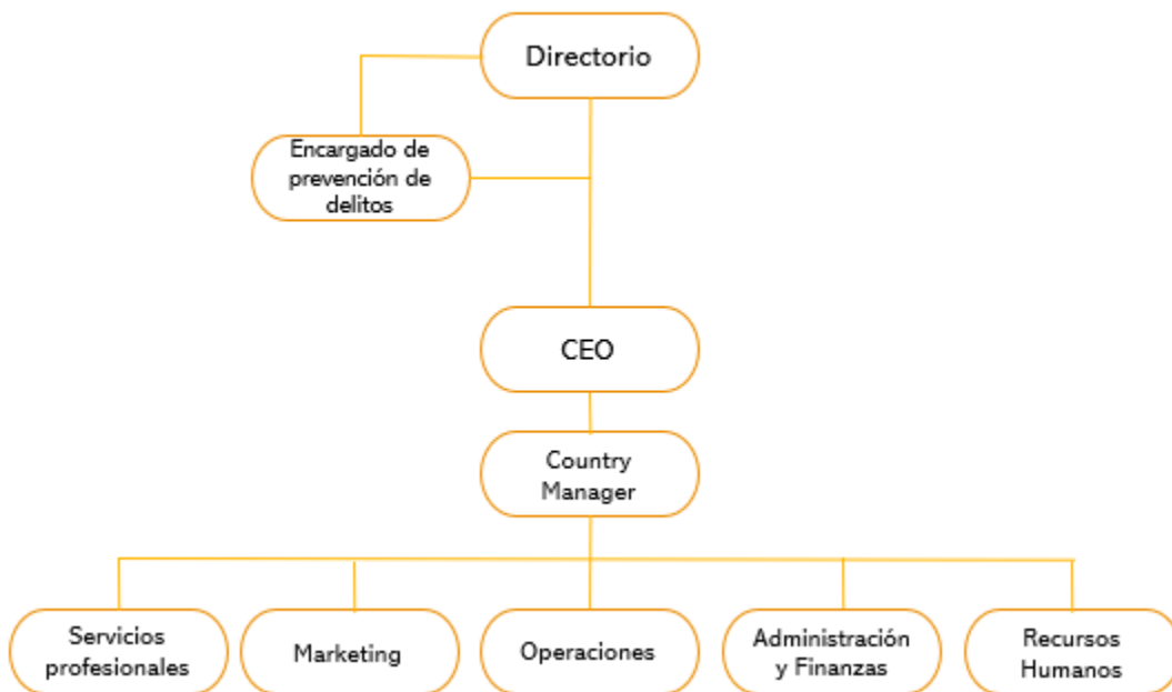
Figura N° 3: Estructura organizacional del modelo de prevención de delitos

La siguiente figura representa la estructura organizacional para gestionar los riesgos de comisión de delitos que pueden afectar a la Compañía.